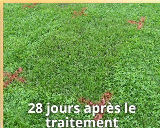
28 jours après le traitement

1:24 appliqué à raison de 18,6 L/1 000 pi 2