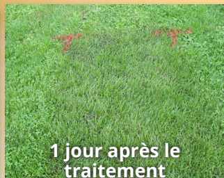
1 jour après le traitement

1:24 appliqué à raison de 18,6 L/1 000 pi 2