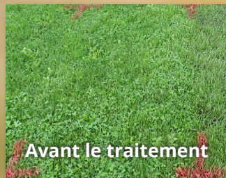
Avant le traitement