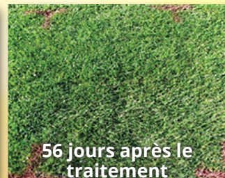
56 jours après le traitement

1:24 appliqué à raison de 18,6 L/1 000 pi 2 2e application, même dose